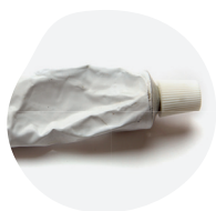
POMMADES, CRÈMES ET GELS...