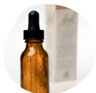
COLLYRES ET SOLUTIONS NON BUVABLES