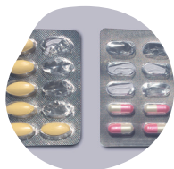
COMPRIMÉS, GÉLULES, POUDRES...

La récupération des médicaments non utilisés à usage humain par les pharmaciens est une obligation légale depuis 2007.