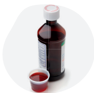
SIROPS ET SOLUTIONS BUVABLES