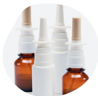
AÉROSOLS ET SPRAYS