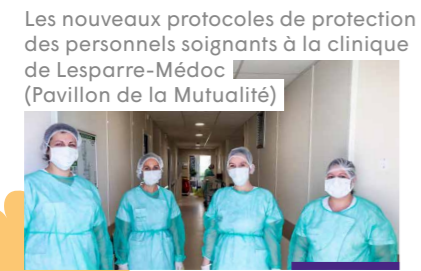
Les nouveaux protocoles de protection des personnels soignants à la clinique de Lesparre-Médoc (Pavillon de la Mutualité)

S'adapter, repenser ses manières de faire et son métier, intégrer les nouveaux protocoles sanitaires, c'est ce qu'ont fait les collaborateurs de VYV 3 , avec l'appui des fonctions support, tout au long de cette pandémie.