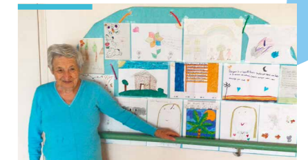
Des dessins d'enfants pour donner du baume au cœur des résidents à l'Ehpad du Languedoc (VYV 3 Sud-Est)