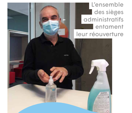
L'ensemble des sièges administratifs entament leur réouverture