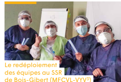
Le redéploiement des équipes au SSR de Bois-Gibert (MFCVL-VYV 3 )