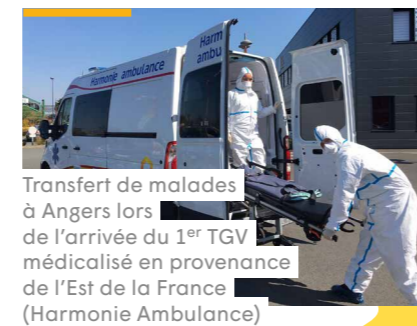
Transfert de malades à Angers lors de l'arrivée du 1 er TGV médicalisé en provenance de l'Est de la France (Harmonie Ambulance)