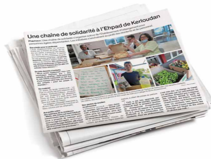
Une chaîne de solidarité à Kerpape (MF Finistère-Morbihan)