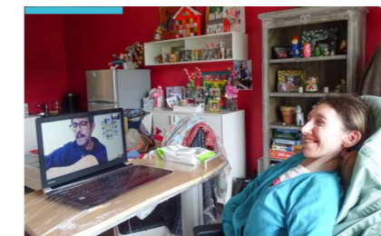
Concert à distance à «La Grande Maison» de Ballan-Miré (MFCVL-VYV 3 )

Concert dans les jardins de l'Ehpad mutualiste de Trédrez - Locquémeau (Mutualité française Côtes d'Armor Ile-et-Vilaine)