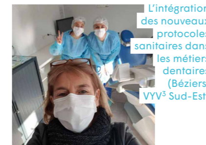
L'intégration des nouveaux protocoles sanitaires dans les métiers dentaires (Béziers, VYV 3 Sud-Est)

Recommencer... la vie qui reprend, pas tout à fait comme avant.