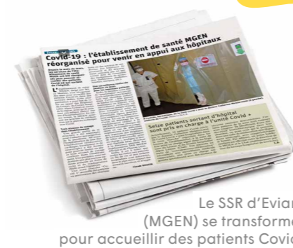
Le SSR d'Evian (MGEN) se transforme pour accueillir des patients Covid