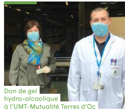
Don de gel hydro-alcoolique à l'UMT-Mutualité Terres d'Oc