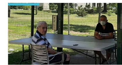
Des retrouvailles en plein air à l'Ehpad de Pessac (Pavillon de la Mutualité)