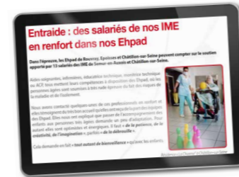
Les collaborateurs des IME en renfort des Ehpad (MFB SSAM)