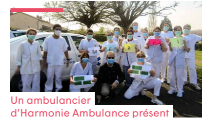
Un ambulancier d'Harmonie Ambulance présent tous les après-midi dans un Ehpad de la Vienne (Mutualité Française Vienne) pour aider aux tâches quotidiennes

La chanson des ambulanciers montre leur engagement quotidien