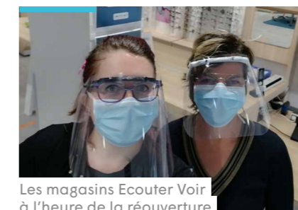
Les magasins Ecouter Voir à l'heure de la réouverture