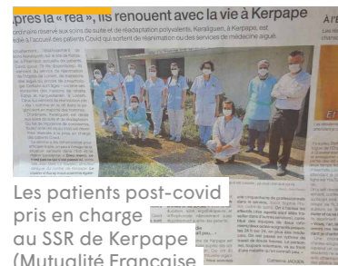
Les patients post-covid pris en charge au SSR de Kerpape (Mutualité Française Finistère-Morbihan)

Harmonie Médical Service adapte son système de distribution face à la pandémie