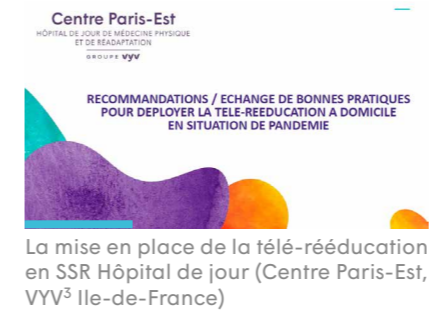
La mise en place de la télé-rééducation en SSR Hôpital de jour (Centre Paris-Est, VYV 3 Ile-de-France)

Si proches, et pourtant si loin... Pendant le confinement, il a fallu de l'attention et de l'inventivité aux collaborateurs de VYV 3 pour accompagner, soutenir, reconforter, divertir les résidents, rassurer les familles et maintenir coûte que coûte le lien avec les proches et le monde extérieur.