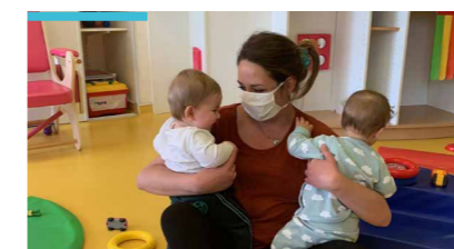
La joie de retrouver les enfants à la crèche des Crêtes (VYV 3 Sud-Est)