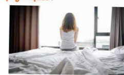
Article d'Essentiel Santé Magazine expliquant comment les établissements santé mentale VYV 3 conservent le lien avec leurs patients

Confinement : quel impact pour les patients ayant des troubles psychiques ?