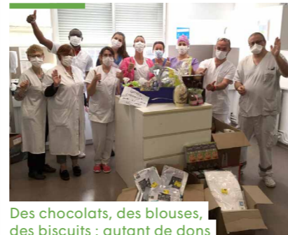
Des chocolats, des blouses, des biscuits : autant de dons pour la clinique Lesparre-Médoc (Pavillon de la Mutualité)