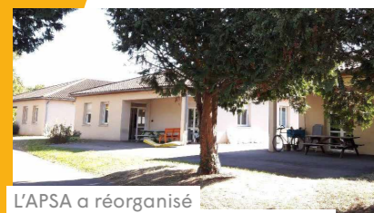
L'APSA a réorganisé ses 3 établissements restés ouverts pendant le confinement et mis en place un suivi dédié pour les résidents retournés à leur domicile