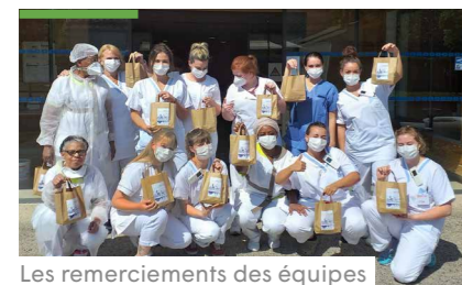
Les remerciements des équipes de l'Ehpad de Chevilly (SVFA)

Une collaboratrice de VYV 3 Pays de la Loire écrit une chanson pour les personnels et résidents des Ehpad