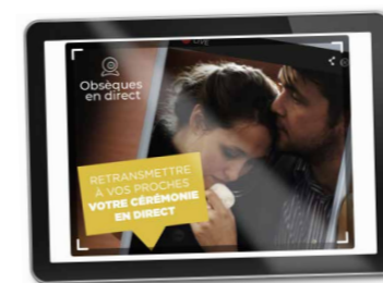
La Maison des Obsèques met en place un service pour aider les familles à mieux traverser le deuil