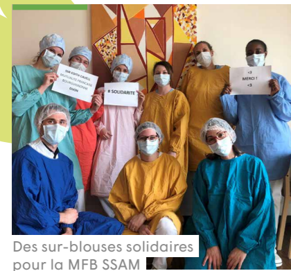
Des sur-blouses solidaires pour la MFB SSAM