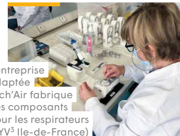
L'entreprise adaptée Tech'Air fabrique des composants pour les respirateurs (VYV 3 Ile-de-France)

L'accueil des enfants de soignants à la crèche les P'tits Bouts de CHU (Angers, VYV 3 Pays de la Loire)