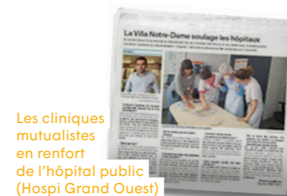
Les cliniques mutualistes en renfort de l'hôpital public (Hospi Grand Ouest)

Confinement : quel impact pour les patients ayant des troubles psychiques ?