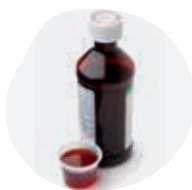
SIROPS ET SOLUTIONS BUVABLES