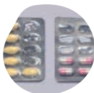
COMPRIMÉS, GÉLULES, POUDRES...

La récupération des médicaments non utilisés à usage humain par les pharmaciens est une obligation légale depuis 2007.