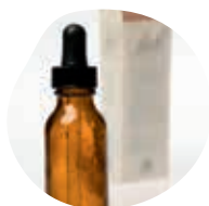
COLLYRES ET SOLUTIONS NON BUVABLES