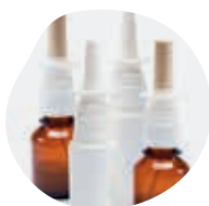
AÉROSOLS ET SPRAYS