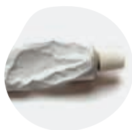
POMMADES, CRÈMES ET GELS...