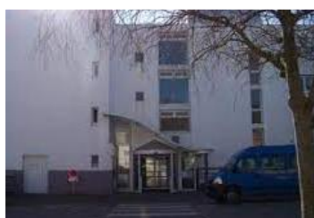
Le Foyer Soleil

A ce jour, ces trois établissements accompagnent 65 personnes.