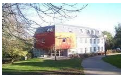
La Villa Cosmao