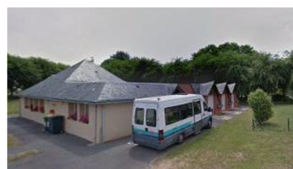
La Villa Soleil

Pour mener la construction, le choix du cabinet d'architecte Agence Rocheteau Saillard (ARS) et du constructeur Legendre a été déterminé en 2020. VYV 3 Bretagne a sollicité les services de l'ESH Les Ajoncs (groupe Arcade VYV) en qualité d'Assistant Maître d'Ouvrage.